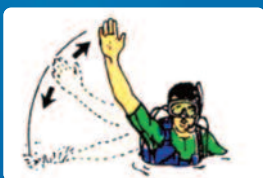
Segítség (Kar fel le mozgásával)