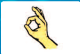
Oké? Oké! (Kérdés és válasz)