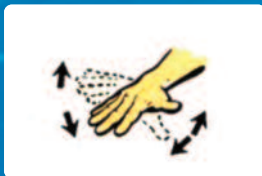
Nem jó, nem oké!