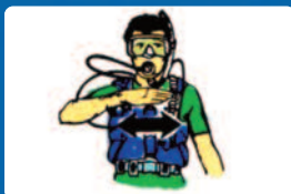
Elfogyott a levegőm.