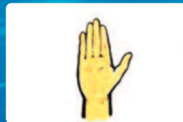
Állj, maradj itt!