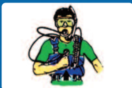
Kevés a levegőm.